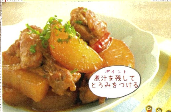
大根と手羽先の オイスターソース煮

オイスターソースや豆板醤などの調味料をついつい余らせてしまうのが悩みなので、こんな煮物に使えると、お料理の幅が広がりますよね。