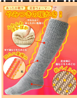
あつたか靴下 足首ウォーマー やみつき暖かさ！