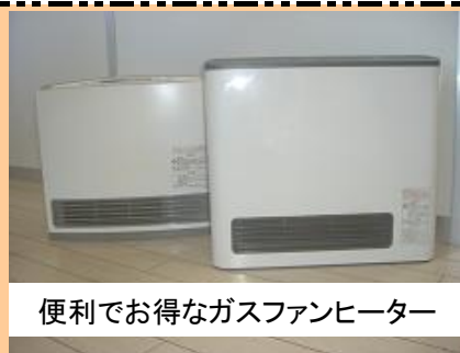
便利でお得なガスファンヒーター