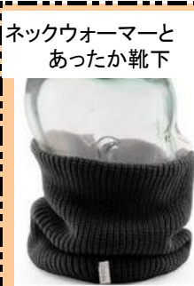
ネックウォーマーとあつたか靴下