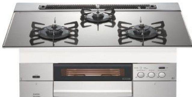
ハーマン S-Blink revor

全国のガスコンロユーザーに愛され早10年使い勝手を追求し、かつ、価格もお手頃に。メーカー一押しのプレミアムモデルです。