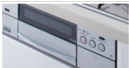
お手入れ楽々フラットフェイス