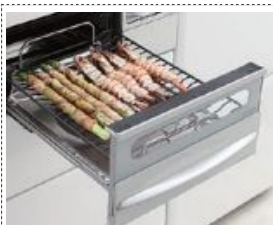
ワイドグリル搭載